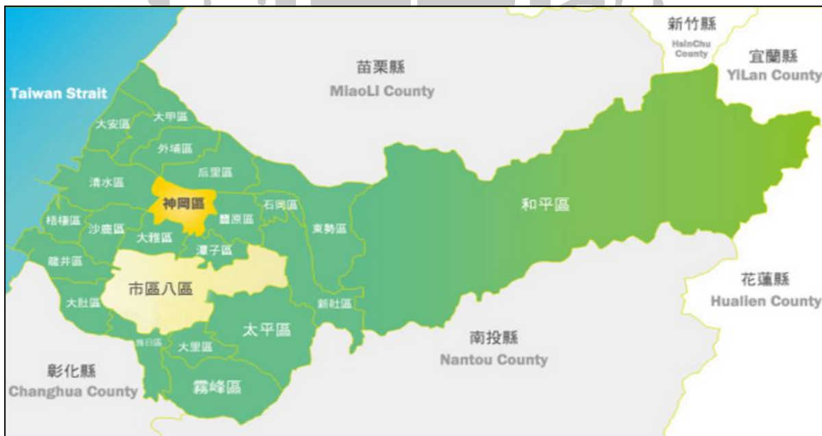
圖 3-1：神岡區地理位置圖

神岡有「早期中部開發中心」之稱，先人入豐原、東勢、后里等地開墾，都需經由本地；因此古蹟很多，這些文化資產已成為神岡擁有發展觀光事業潛力。自民國67年中山高速公路通車以來，在神岡岸裡村設置豐原交流，使得神岡成為原台中縣交通樞紐，而高速公路豐原交流道自然成為神岡重要地標（見圖3-1及表3-1）。