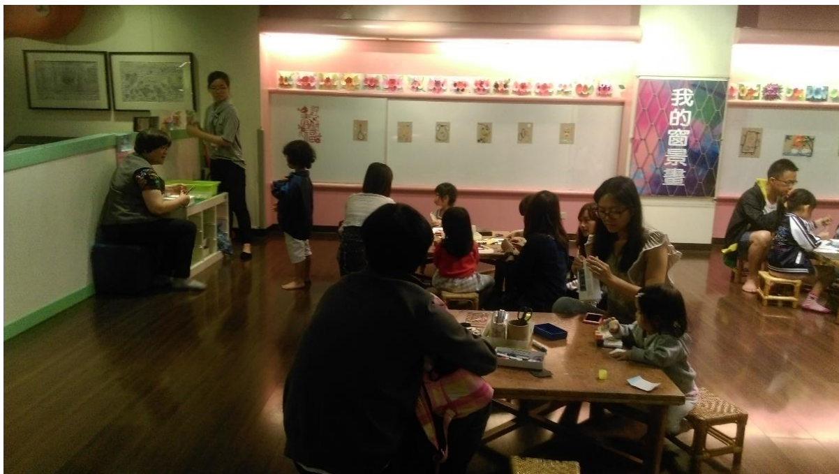
圖4 「藝術駐點員」值勤地點一兒童遊戲室操作區，攝於 04/21/2017。

參與者展覽區值勤點之一：唐唐發作品《流動菜攤》位於美術街，相當接近美術館大門口，假日人潮時而湧現。此作品是裝置作品、富有生活情境，觀眾容易碰觸、越線。如何跟觀眾溝通與維持秩序，是參與者的挑戰。