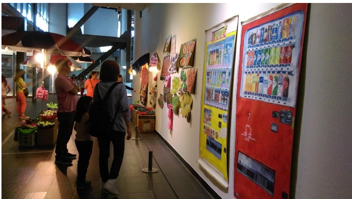
圖3 「藝術駐點員」值勤地點一展覽區《流動菜攤》，攝於 04/09/2017。

參與者展覽區值勤點之一：唐唐發作品《流動菜攤》位於美術街，相當接近美術館大門口，假日人潮時而湧現。此作品是裝置作品、富有生活情境，觀眾容易碰觸、越線。如何跟觀眾溝通與維持秩序，是參與者的挑戰。