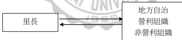
圖 1-2 研究架構

本次的研究架構，從地方自治的未來與民眾的期許，探討提升地方政府政策推行效率方面，里長可以做的事；非營利組織對地方自治的影響；政府在法律上應如何修法，使營利組織與非營利組織更有意願配合地方政府政務的推動；里長引導營利組織，需要哪些法律予以規範；營利組織及非營利組織結合里長在地方自治的角色扮演上之可行性研究等相關研究問題，建構以下研究面向，其研究架構如圖1-2：