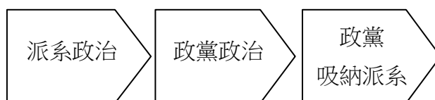
圖 3-1 政黨吸納派系