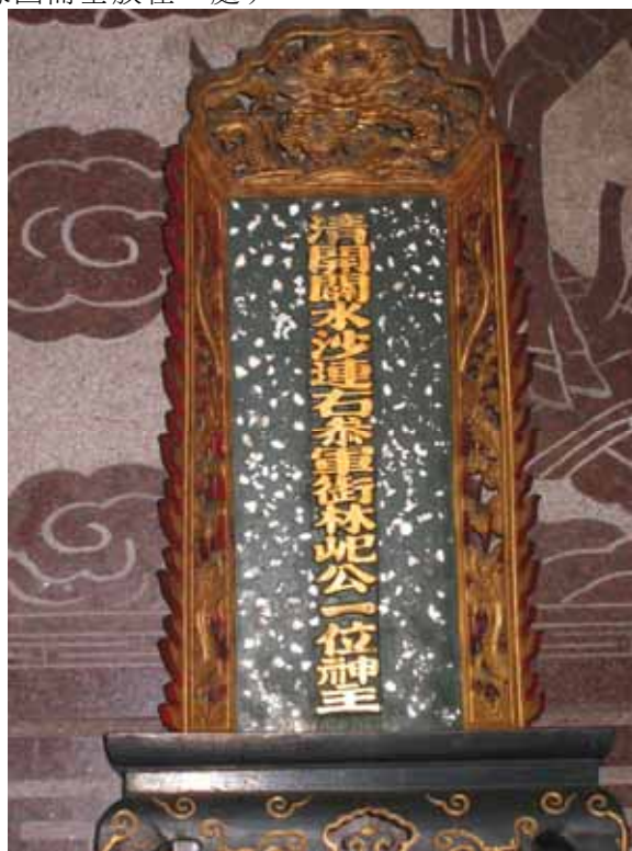
圖 4 林姓宗祠崇本堂供奉「清開關水沙連右參軍銜林紀公一位神主」