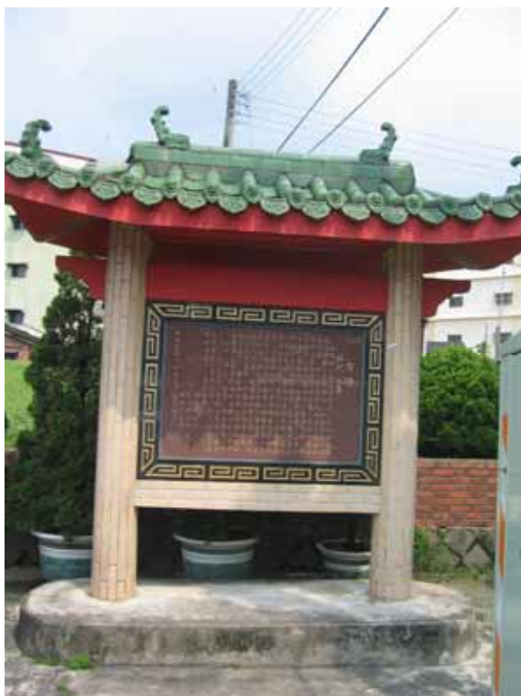
圖 1 林圯公墓碑