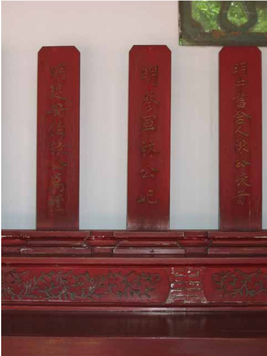
圖 5 臺南延平郡王祠東廡配祀「明參軍林公祀」牌位