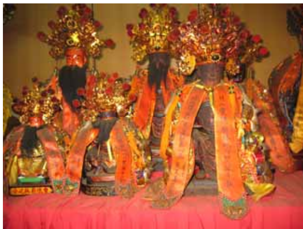
圖 3 竹山城隍廟供奉林紀公神像（前列 3 尊。該廟目前正在整修，神像因而全放在一處）