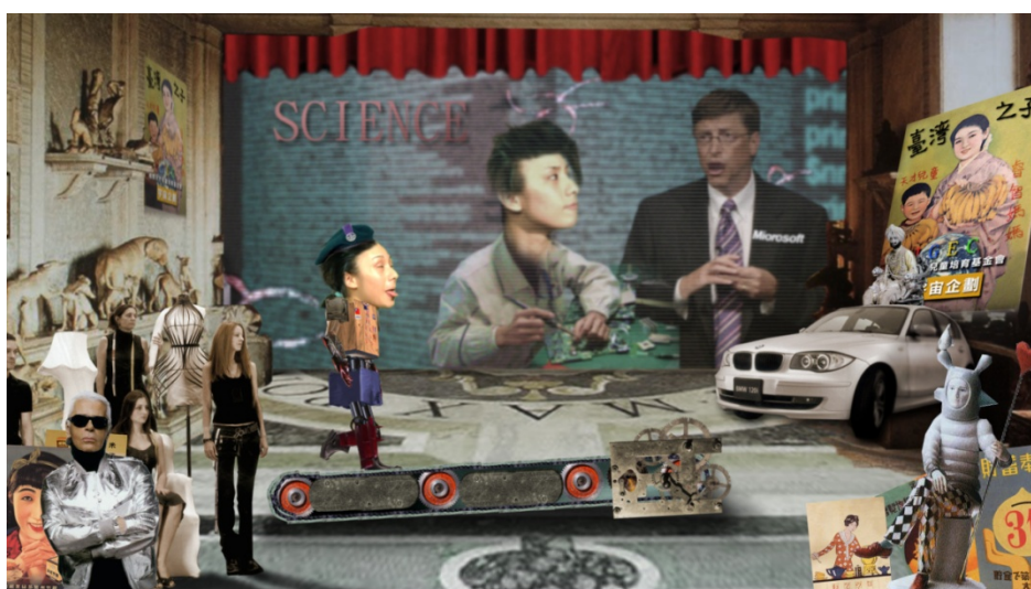
(圖 3-9) 《五大華人之光-鐵漢》影片片段。五育並重全人教學 2。