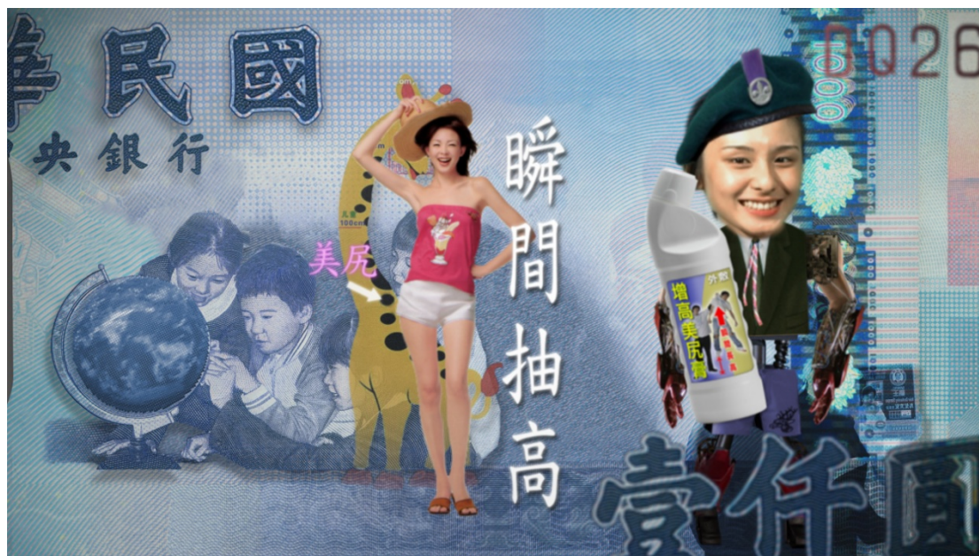
(圖 3-1) 《五大華人之光-鐵漢》影片片段。萬般皆下品，為有賺錢高。

最後拉出畫面，一個台灣原住民小孩看著電視做著體操，向他的媽媽大喊要求，他也要去參加銀河系全方位奈米竹炭 0~99 歲教育基金會，他的媽媽回應他非常支持他去參加銀河系全方位奈米竹炭 0~99 歲教育基金會，小孩大喊:<我也要當華人之光啦>。最後畫面定格在主角臉上，吐著舌頭扮鬼臉，為這個荒唐劇目最為收場。