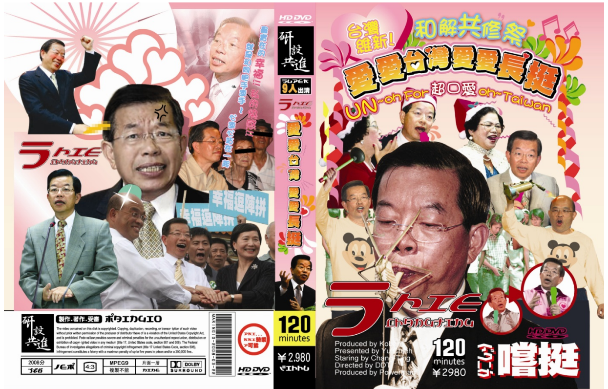
(圖 2-13) 《築愛救台灣》愛愛台灣愛愛長挺 立體裝置平面圖像