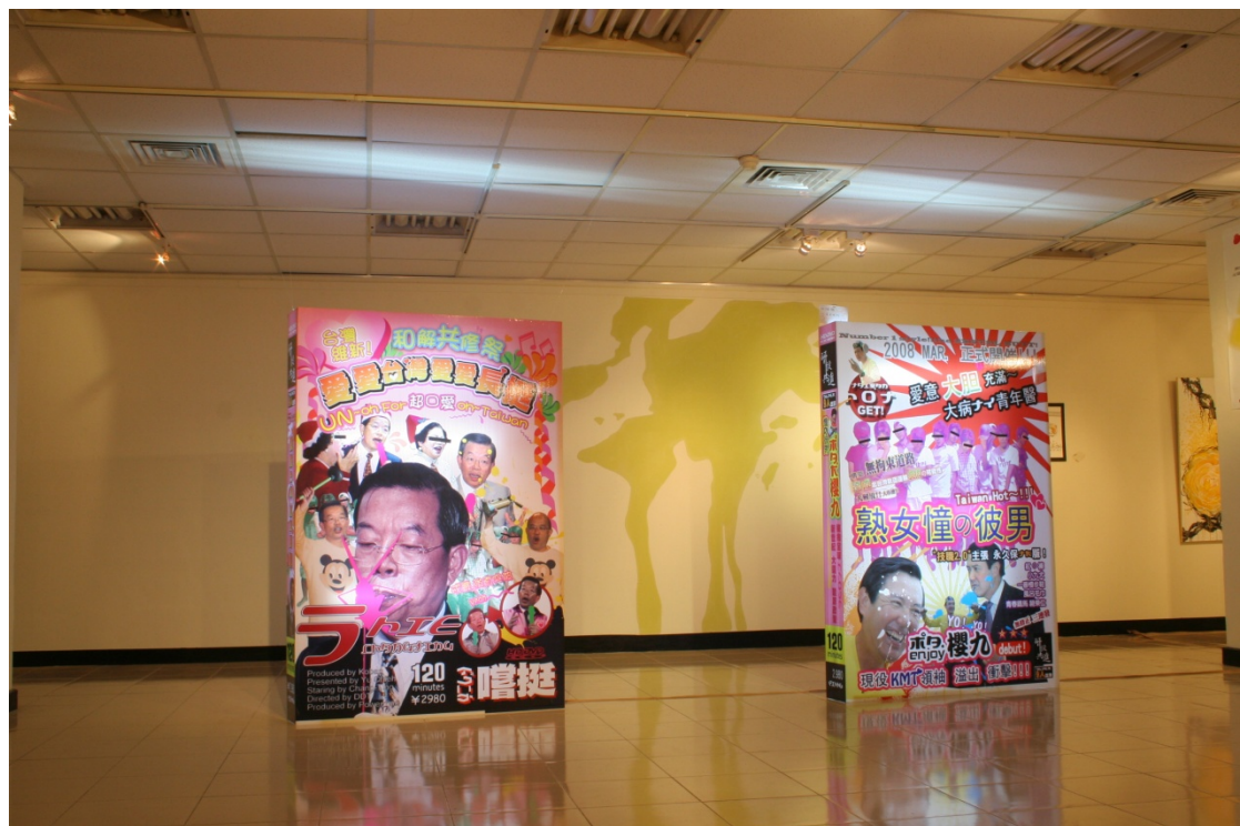
(圖 2-14) 《築愛救台灣》2008 高雄師範大學 展出