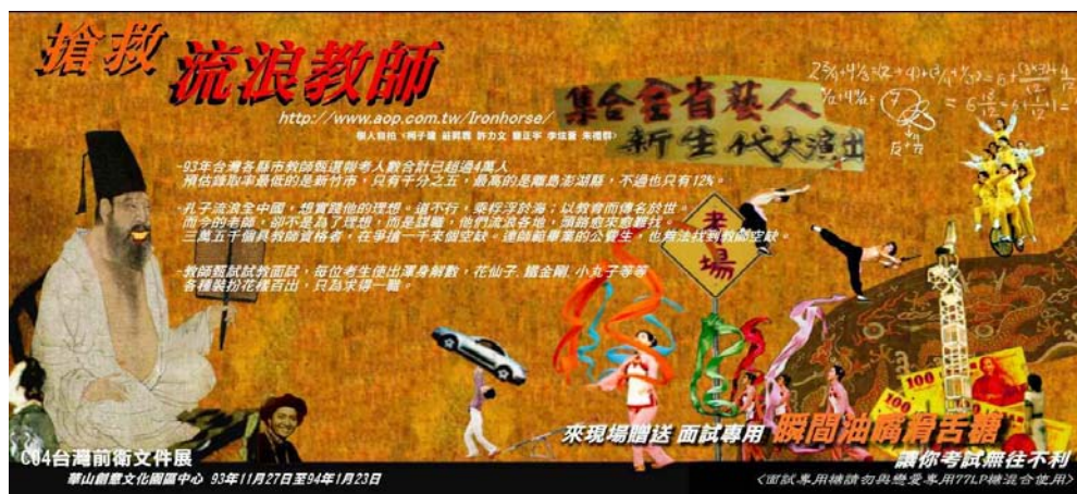
(圖 2-9) 《五大華人之光-鐵馬》 宣傳 DM-2