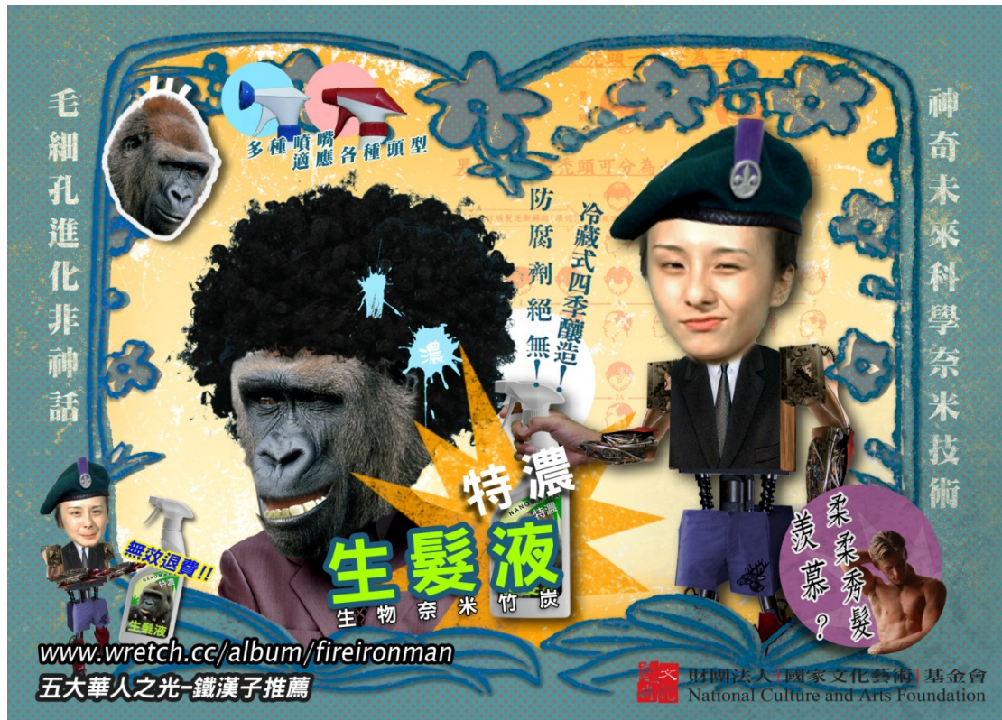
(圖 3-5) 《五大華人之光-鐵漢》宣傳 DM。 販售猩猩生髮液，使毛髮比猩猩還要多。