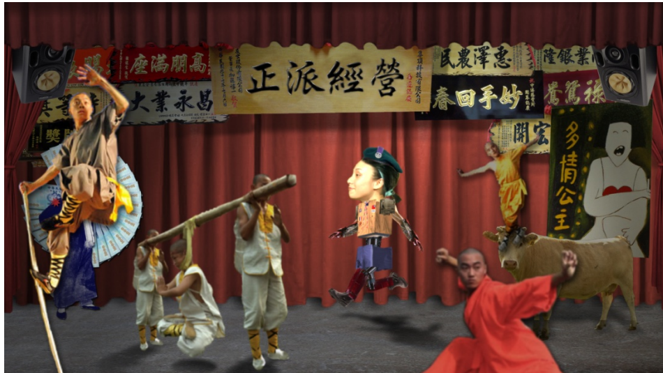
(圖 3-10) 《五大華人之光-鐵漢》影片片段。工作累條狗，薪水卻沒有。