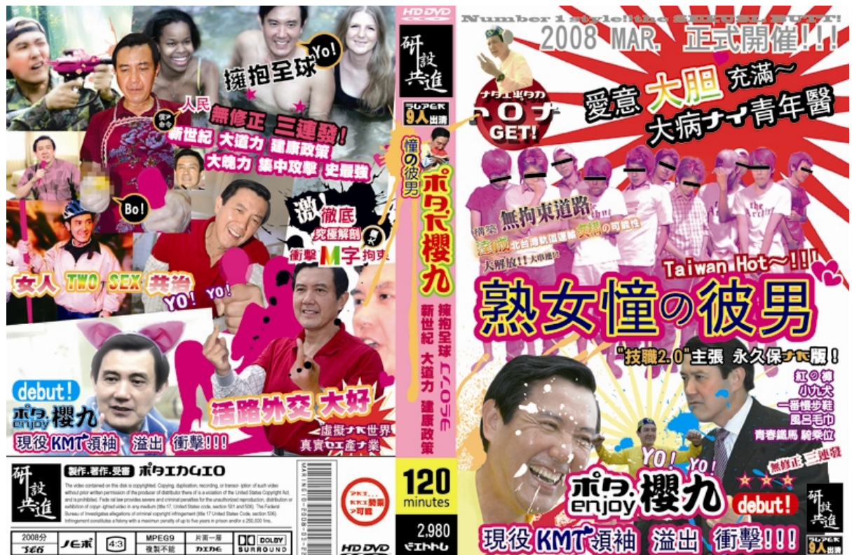
(圖 2-12) 《築愛救台灣》熟女懂の彼男 立體裝置平面圖像