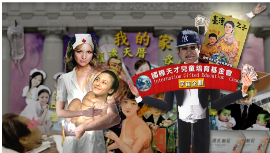
(圖 3-7) 《五大華人之光-鐵漢》影片片段。天才兒童培育基金會。