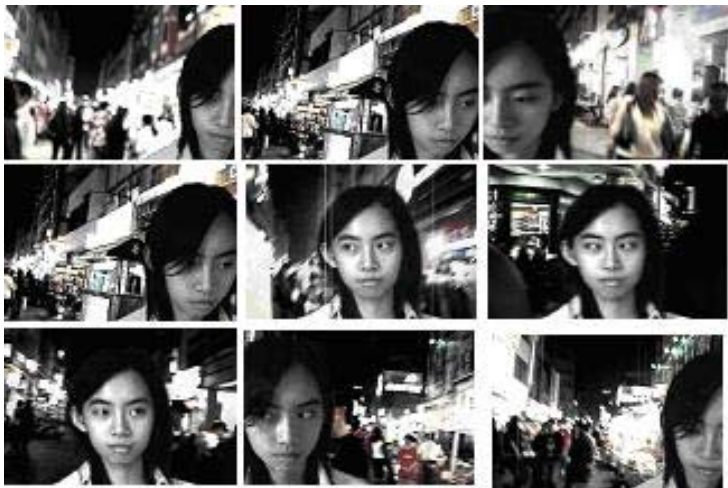
(圖 2-1) 錄像作品 《loneliness》截圖

自大學時代開始，個人創作期望以一種可以承載更多情感與傳達更多理念的形式來進行創作，所以除了學校所學的繪畫形式與觀念藝術之外，開始而自學電影製作與錄像藝術，於大二時期(2001 年)製作第一步實驗錄像作品「loneliness」，探討私人情感之斷面，使用三個不同的故事，三個不同的原因，一個相同的結果 --「loneliness」(圖 2-1)，作品呈現方式有個相同的特徵，就是都沒有語言的存在。