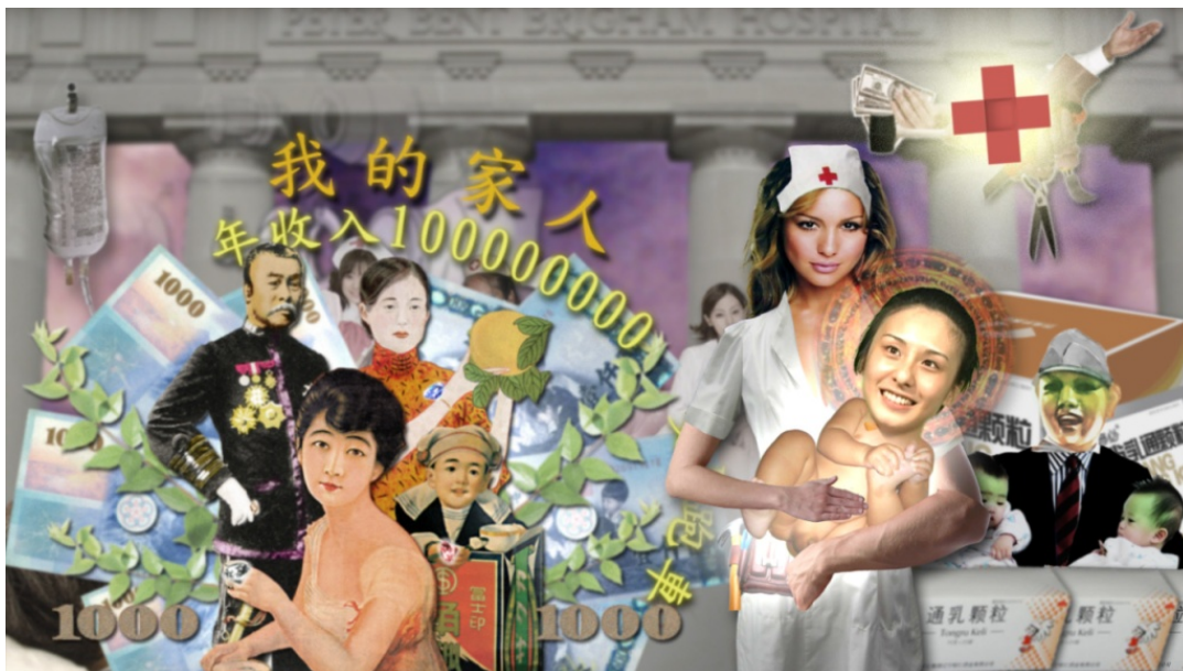
(圖 3-6) 《五大華人之光-鐵漢》影片片段。出生含著金湯匙，人生規畫很充實。