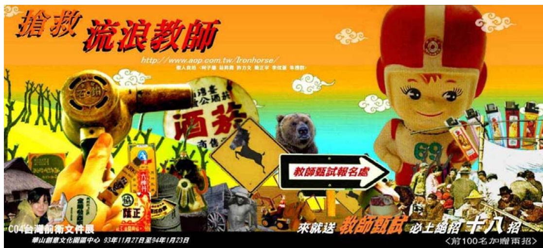
(圖 2-8) 《五大華人之光-鐵馬》 宣傳 DM-1

到色情影片的內容，如:<愛愛台灣愛愛嚐挺>、<現役 KMT 領袖溢出衝擊>、<擁抱全球無修正三連發>等等性愛光碟暗示標題來諷刺當時總統大選戰火紛烈當中提出的<築愛共修>聲明。作品形式有網路動畫、平面海報、專屬網頁與歌曲創作進行，內容使用真實圖像進行拼貼與再製，人物聲音的虛擬與捏造的對白進行創作，作品形式表現展現了我這個世代的流行風潮與網路語彙，KUSO、錯置與卡漫風格。