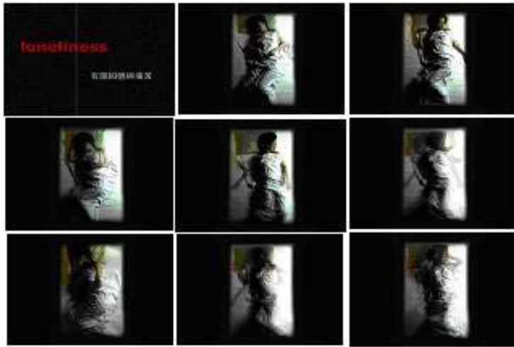
(圖 2-3) 錄像作品 《loneliness》截圖

在第一部 Video Art 創作之後，開始嘗試創作實驗電影，第一部實驗電影《SPAGHETTI》(2002) 與以往的個人創作比較不同的是，無法以私密的創作模式進行，而必須大量與人溝通與協調，除了在導戲方面與製作流程上都與以往的私密創作過程不太相同。但是使用實驗電影的創作形式，使我了解到錄像藝術與意念傳遞可以透過更多元的方式來詮釋。就在個人創作完《SPAGHETTI》實驗電影之後便開始進行首部電影長片《SMILE ISACC》(2003)的創作，這部首部電影長片的製作做準備，開始為期六個月的電影前製作業與電影工作團隊訓練，從編劇、攝影、美術、剪接與音樂創作每一環節皆仔細處理，電影並且之後於高雄電影圖書館、新竹影像博物館、台南社教館、高雄師範大學禮堂與台灣前衛文件展(CO4)巡迴放映展出。