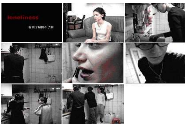
(圖 2-2) 錄像作品 《loneliness》截圖