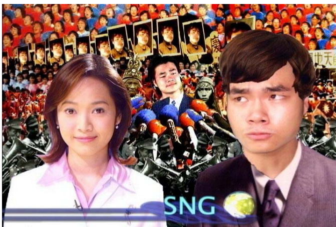
(圖 2-11) 《五大華人之光-鐵馬》片段。考了 15 教師甄試讓我體會到 活到老學到老。