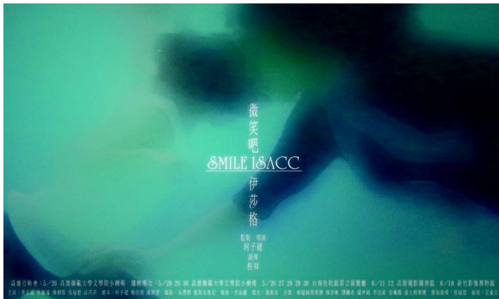
(圖 2-5)電影《SMILE ISACC》海報