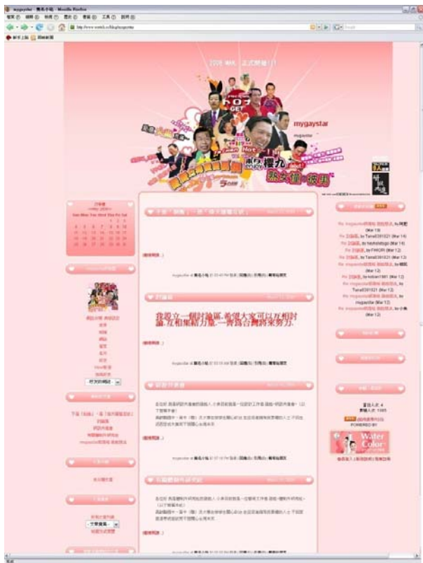
(圖 2-16) 《築愛救台灣》 影音網頁