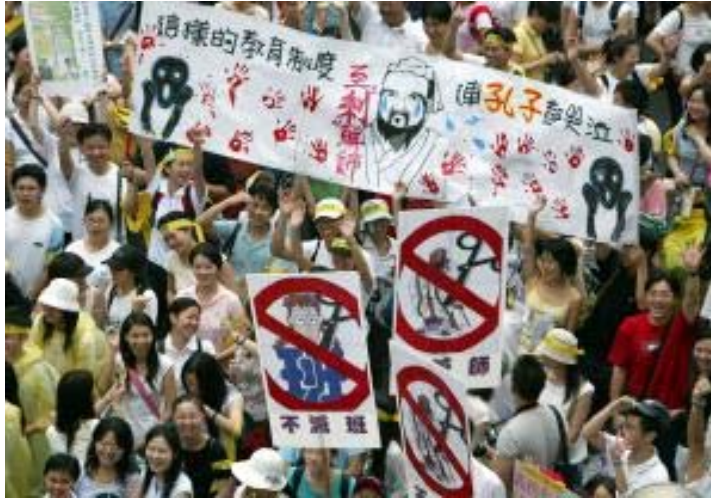
(圖 2-6) 2005 年 6 月 12 日「六一二拯救國教大遊行」活動照片 1