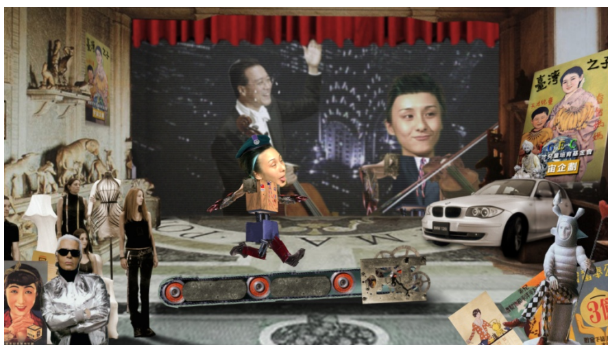
(圖 3-8) 《五大華人之光-鐵漢》影片片段。五育並重全人教學 1。