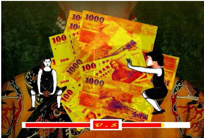
(圖 2-10) 《五大華人之光-鐵馬》片段。四書五經大道理-不敵紅包送錢大贈禮。