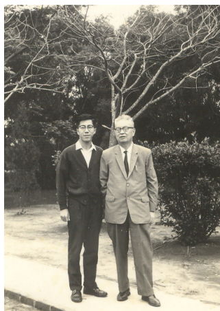
孫先生與楊學長合攝