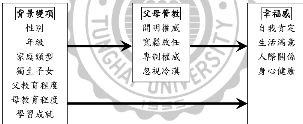
圖 3-1 研究架構圖

本研究主要目的在探索不同父母管教方式、背景變項與幸福感之差異，基於上述論點，所設計的研究基本架構包括背景變項、父母管教方式與幸福感，如圖 3-1 所示。