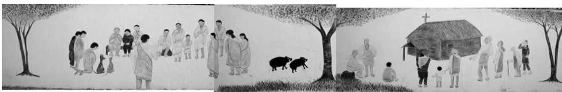
(2007年6月16日牆壁製作大功告成，賽德克之信仰圖)

但由於當地的人們多半為老年人與小朋友居多，多半沒有此方面的經驗，故幾乎都是由東海的學生完成的。從牆壁剝落的修復、油漆、繪製等，僅僅花了短短兩個月就完成了，而這就是第一次的圍牆製作。