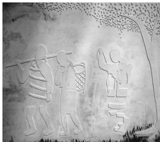
(2011年：第二次牆壁製作)

在第二次牆壁製作的部分，比起第一次的製作工程較為繁瑣困難，所以工程延宕甚久，且每每參加人數也不多，故耗費了許多時間。光是割製模樣、貼黏瓷磚、塗防水油漆等工程就耗費了將近一年又五個月，而剩下的人物上色的部分也是一個具有挑戰