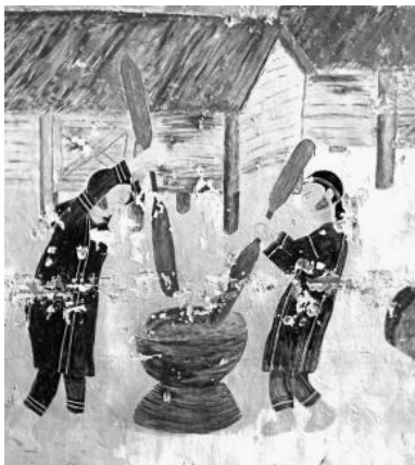
(2011 年牆壁剝落的情況愈加嚴重)

2011 年開始了第二的牆壁製作。整體設計上沒有太大幅度的改變，唯一改變的是用料的部份，我們棄用直接在牆壁上塗料，而採用看似繁複但卻耐用的方法。首先，我們先將牆壁整體清潔乾淨，再來，在牆上塗上白色的防水油漆，待牆壁油漆，再塗上第二層的防水油漆，不斷的循環這個動作，此動作是為了要增加牆壁的耐用度。隨後，各工作人員在各自將牆壁上的人物畫在紙上，再將畫在紙上的形狀剪下描繪在瓷磚上，利用電鑽將瓷磚上的形狀一一割下，割下來的瓷磚在利用專用的黏著劑貼黏在牆壁上，並用榔頭敲置固定與牆壁之形狀吻合，待其專用的黏著劑乾後，在瓷磚上塗上防水油漆且不斷的循環這個動作。