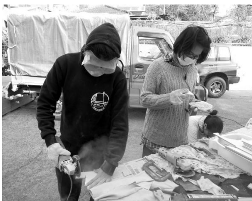
3.待專用黏著劑乾後，塗上一層層防水油漆