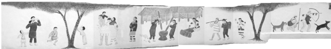
(2007年大家一起合力繪製牆壁的設計，賽德克之生活圖)