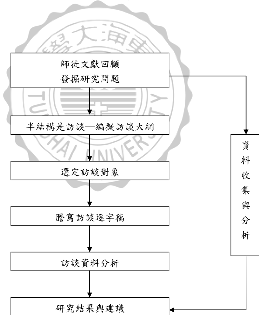
圖 3-1 質性研究設計圖

本研究採用質性研究方法，質性訪談是一種為特殊目的而進行的談話－研究者與被訪問者，主要著重於受訪者個人的感受（perception of self）、生活與經驗（life and experience）的陳述，藉著彼此的對話，研究者得以獲得、了解及解釋受訪者個人對社會事實（social reality）的認知（Minichielloetal, 1995）。首先回顧師徒之相關文獻進行內容分析，分析其關係與功能。同時擬定訪談大綱，探討高職校園師徒關係與功能，藉由半結構式深度訪談，研究內容主要為師徒關係與功能，最後歸納與分析。研究設計圖如下：