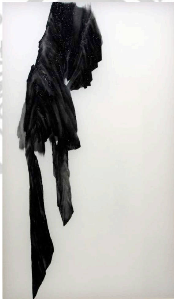
圖 49 洪于庭，〈聖殤〉，2014 年，絹本膠彩， 127x77cm 。

創作說明： 空間處理，逐漸將透視空間的消匿使創作更能自由的放縱想像。 色調的細膩變化和積點的濃疏相間，景深雖消匿，難以判定遠近感， 形成更近似另類的視覺印象。