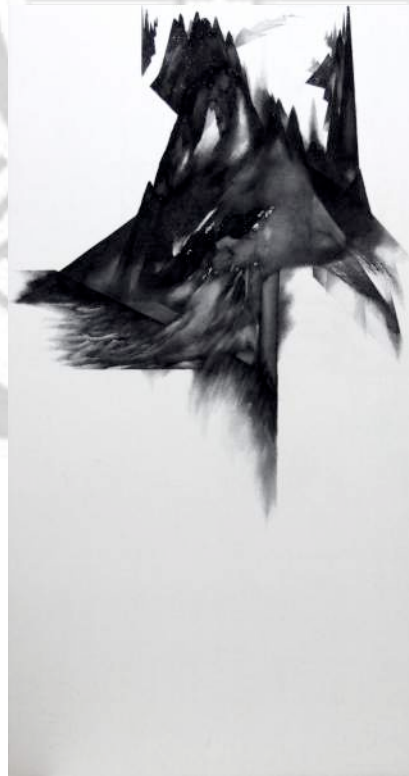
圖 45 洪于庭，〈夢空間夢〉，2013 年，絹本膠彩，112x50cm。

創作說明： 本空無一物的空間，原只是湊巧的樺接，卻成盤錯兩條軸線，慢慢發現，盤錯的延深至過無止盡似的，浮現了異想之外的潛在感知，同感巴舍拉在《空間詩學》中所言「這樣的日夢在召喚著縱深感。它們是在連綿敘事中的停頓，在此逗留之時，讀者受邀做著夢」。黑在畫面配置上所凸顯的界域，造成抽象空間的多層次感，留白之處則還能再連綿敘事的製造白日夢。