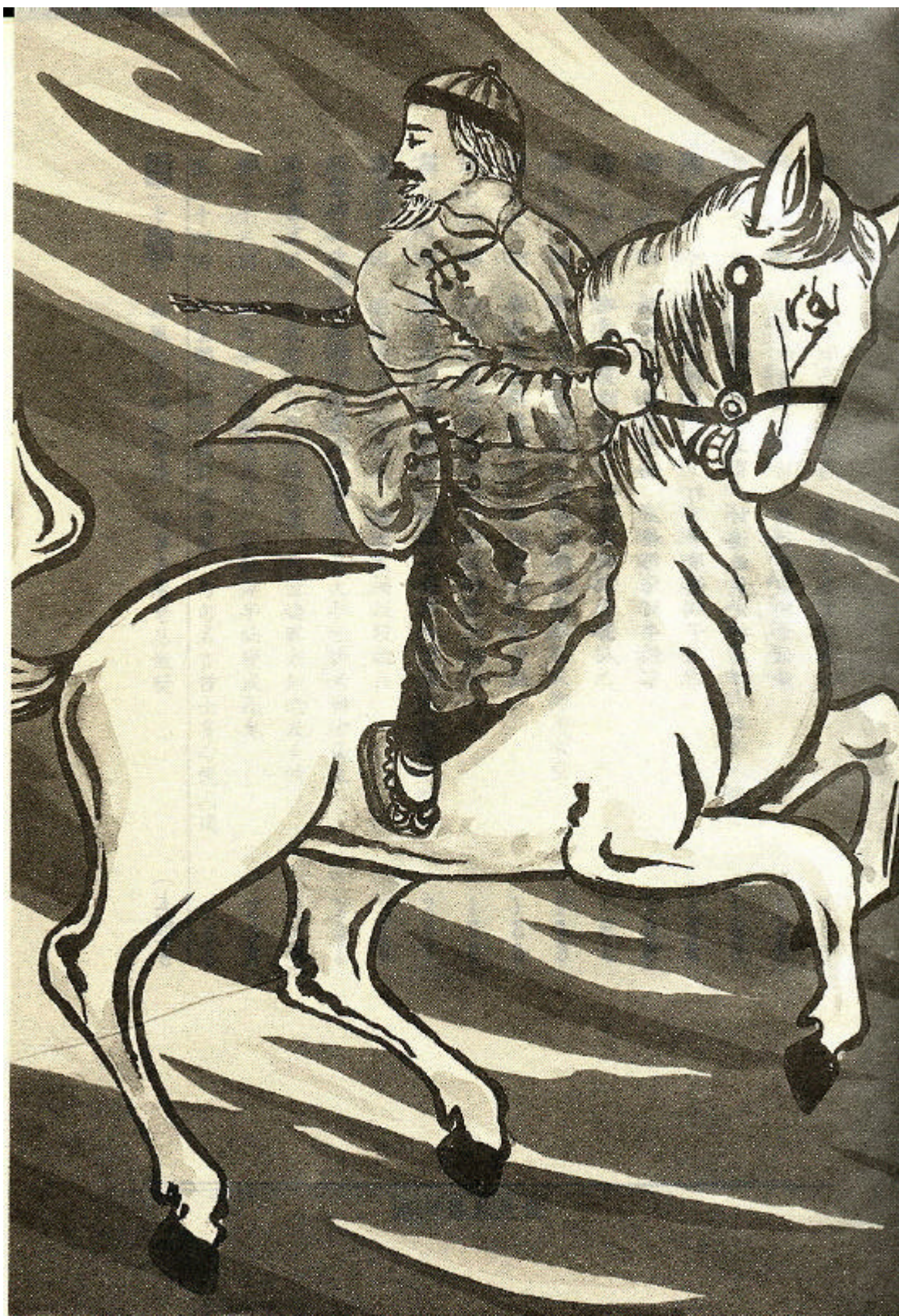
圖 6 《鯤島逸史》於 1944 年由南方雜誌社出版時之封面（上冊）