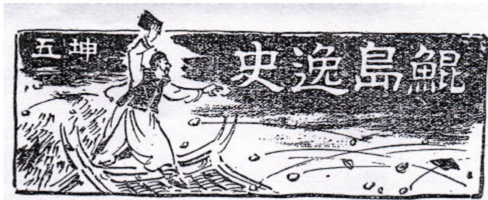
圖 2 《鯤島逸史》於《南方》雜誌連載時之刊頭（第 6 回以後）