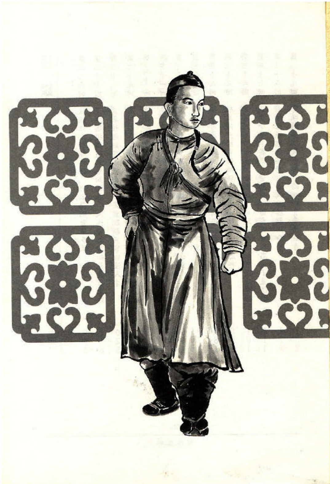
圖 7 《鯤島逸史》於 1944 年由南方雜誌社出版時之封面（下冊）